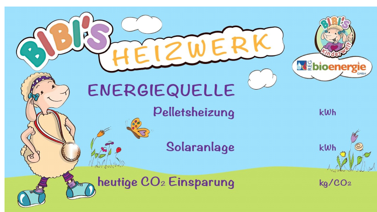
Abbildung 3: Skizze der Tafel Bibis Heizwelt

Auf der Außenwand der Heizzentrale wird eine Infotafel mit aktuellen Zählerdaten montiert. Ins Design der Tafel wurde Schaf Bibi, das Maskottchen des Feriendorfes, integriert.