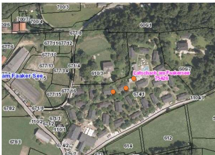
Abbildung 1: KAGIS Auszug des Grundstückes

In Nachfolgender Abbildung sind die Solarflächen im KAGIS Auszug des versorgten Gebietes mit roten Punkt gekennzeichnet.